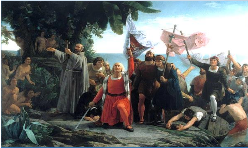
« Descubrimiento de América » 12 de octubre de 1492.