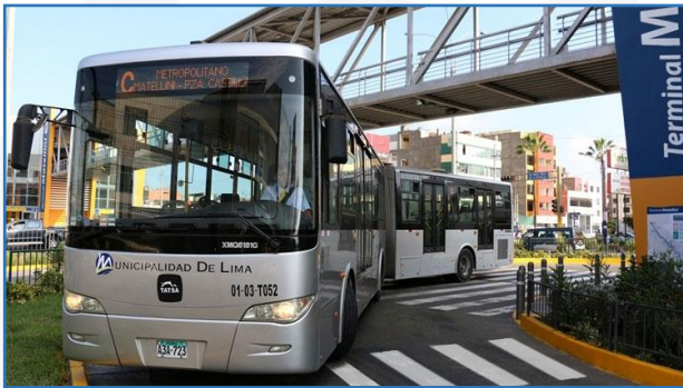
Servicio de transporte público: Metropolitano de Lima.

Son aquellos que se brinda simultáneamente a grupos de gente, como la educación, el transporte público (Metropolitano de Lima), el alumbrado público, la limpieza pública, mantenimiento de parques y jardines, etc.