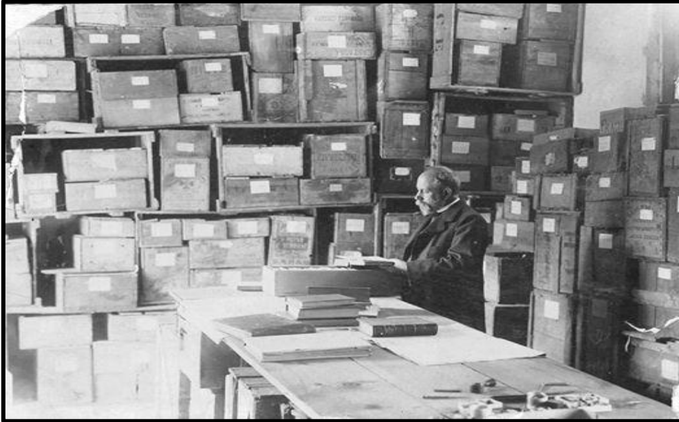
Florentino Ameghino en su depósito arqueológico (1902).