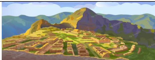
P _____ (V _____)